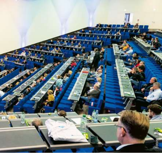
Die große Kongresshalle der Messe Düsseldorf voller Sicherheitsbeauftragter unterschiedlicher Branchen – natürlich alles mit Abstand wegen Corona

Die Vernetzung ist immens wichtig, scheitert aber oft daran, dass SiBe kaum ihre Arbeitsbereiche verlassen. Manche werden selbst aktiv mit Chatgruppen oder anderen Lösungen. Die Einbindung in den Arbeitsschutz im Betrieb können SiBe zwar fordern, organisatorisch umsetzen müssen es aber die zuständigen Fach- und Führungskräfte, mit denen wir darüber sprechen werden, z. B. müssen mindestens zwei SiBe bei den Sitzungen des Arbeitsschutzausschusses ‚ASA‘ dabei sein. In Betrieben mit mehr als zwei SiBe muss man dann Lösungen finden, mit denen auch die nicht anwesenden SiBe im Vorfeld und im Nachgang des ASA informiert werden.