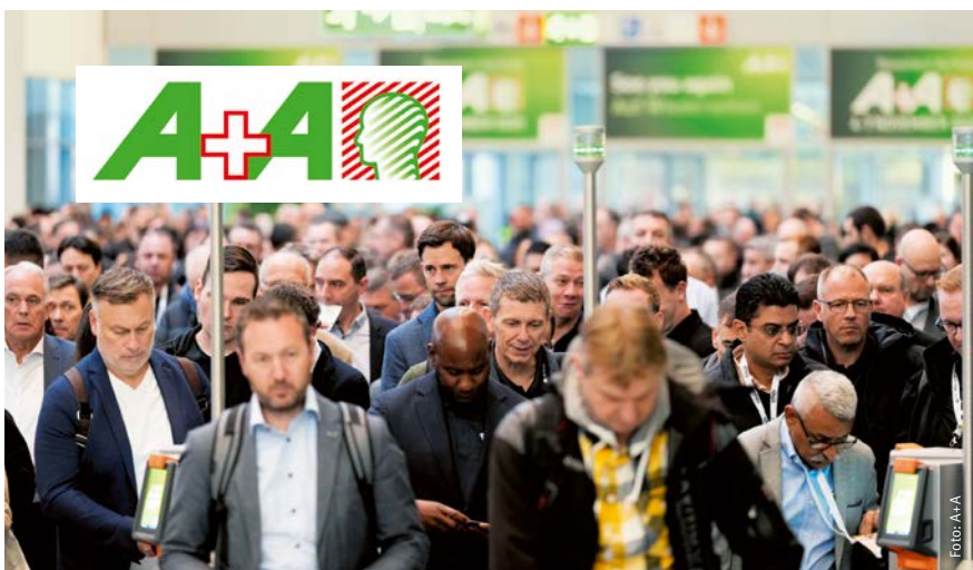
62.000 Menschen aus 140 Ländern besuchten Düsseldorf zur A+A, darunter die Gäste für den Tag der Sicherheitsbeauftragten

Wie läuft es eigentlich so als Sicherheitsbeauftragte (SiBe)? Gelegenheit zum Austausch darüber gab der „Tag der Sicherheitsbeauftragten“ auf der „A+A Internationalen Fachmesse und Kongress für sicheres und gesundes Arbeiten“. Dort ging es um die Unterstützung, die SiBe sich im Arbeitsalltag für ihr Ehrenamt wünschen.