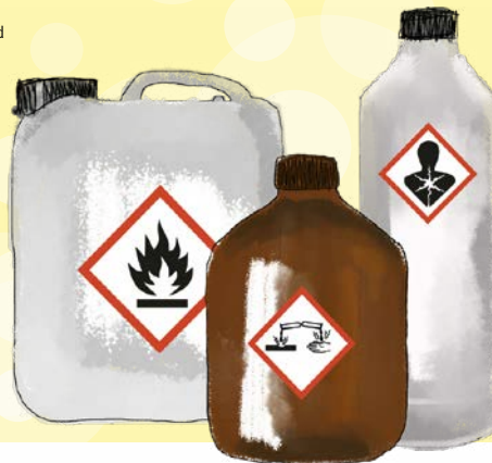
ILLUSTRATION: HANSELEI WIESEN

Wann welche PSA zu tragen ist, steht in der Betriebsanweisung, z. B. Schutzhandschuhe, Atemschutz, Augen- oder Gesichtsschutz.