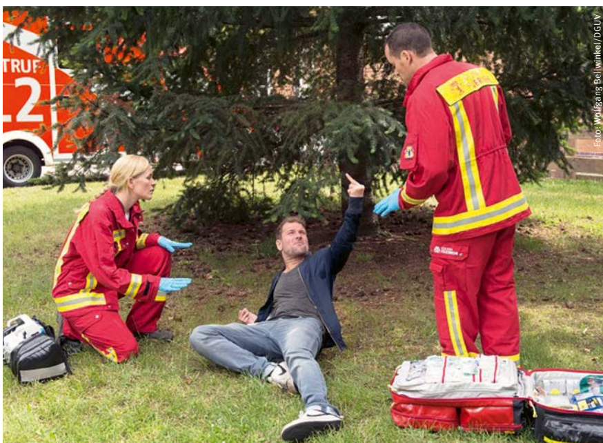
Jede Situation ist anders und erfordert ein angepasstes Reagieren.

zum Beispiel, wenn eine Person unruhig und getrieben wirkt. Dieses Gefühl ist ein wichtiger Indikator, um wachsam zu sein, Hilfe zu holen und sich selbst in Sicherheit zu bringen.“ Nicht zu akzeptieren ist auch die Beleidigung von Menschen, die vermeintlich einen Migrationshintergrund haben. Hier ist eine möglichst selbstbewusste Haltung der Betroffenen wichtig. Dazu trägt die eindeutige Solidarität durch Kolleginnen und Kollegen sowie Vorgesetzte bei. Außerdem ist zu prüfen, ob gegebenenfalls Sanktionen wie Hausverbote gegen die aggressive Person zu ergreifen sind. Nach solchen Ereignissen sollten Unterstützungsangebote durch den Betrieb erfolgen und auch hier kann das Instrument der Gefährdungsbeurteilung genutzt werden, um das Team gegen derartige Übergriffe zu wappnen.